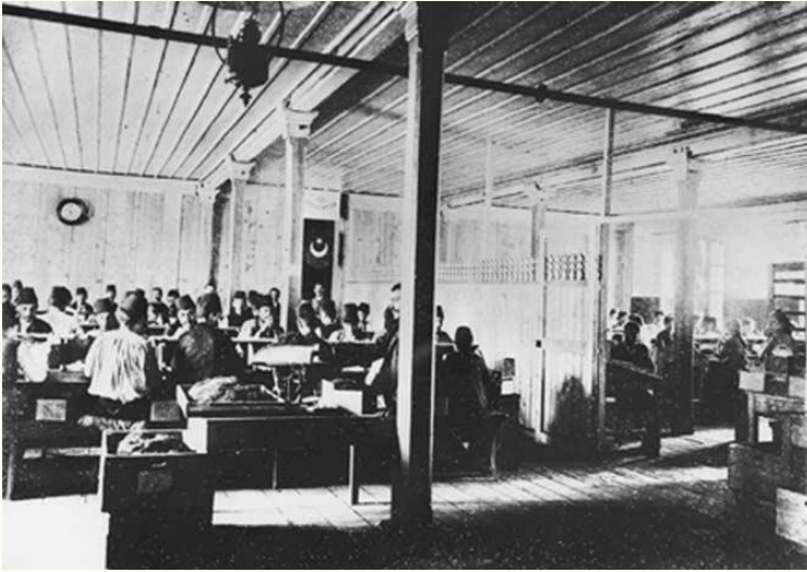
Cibali Tütün Fabrikasında Paravanla Ayrılan Erkek-Kadın işçiler.

Kur'an-ı kerim, güçlü ve emin olmayı, işçide aranan 2 hususiyet olarak sayar. Nitekim Medyenli kız, babasına genç Hazret-i Musa'yı bu vasıfları sebebiyle tavsiye etmiş; 10 sene kâhya olarak hizmet eden Hazret-i Musa, güzel bir ücretle ayrılmış; patronun akıllı kızıyla evlenmişti. Abdullah bin Mes'ud, bu kızın en ferâsetli üç kişiden biri olduğunu söyler. Diğerleri Hazret-i Yusuf'u köle pazarında satın alan Mısır azizi (maliye vekili) ve Hazret-i Ömer'i yerine halife tayin eden Hazret-i Ebu Bekr'dir.