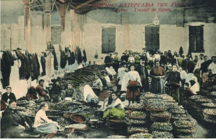
İzmir'de ziraat işçileri