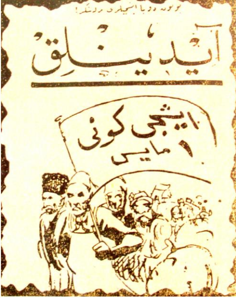
Aydınlık gazetesinde 1 Mayıs İşçi Günü manşeti