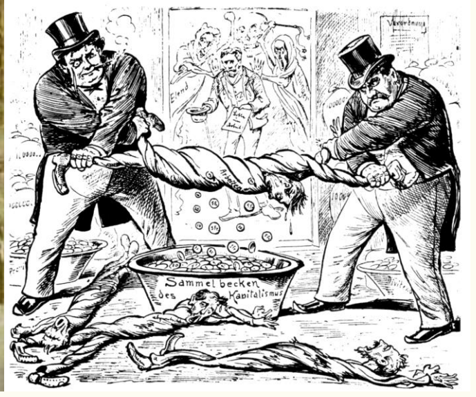
İsviçre'de işçi-işveren münasebetlerini gösteren bir karikatür - 1896